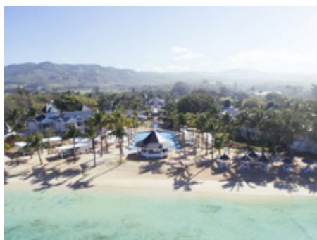
MAURITIUS: HERITAGE LE TELFAIR HOTEL REVIEW HOUSE OF COCO - ESCAPE THE EVERYDAY