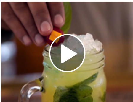
CAVENDISH BAR HERITAGE LE TELFAIR GOLF & WELLNESS RESORT