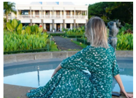
EXPLORE NOU ZIL LIVE A DREAM NIGHT AT HERITAGE LE CHÂTEAU IN BEL-OMBRE, MAURITIUS