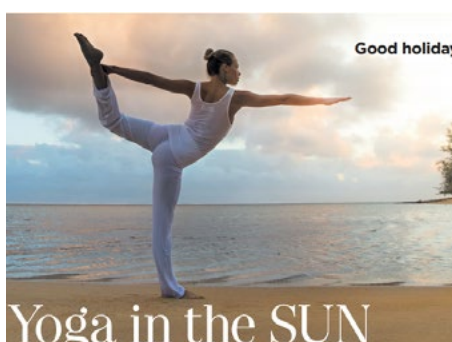
GOOD HOUSEKEEPING | GOOD HOLIDAYS YOGA IN THE SUN