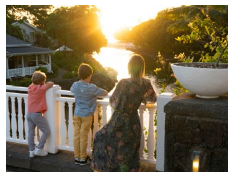
EXPLORE NOU ZIL A TIMELESS BREAK AT HERITAGE LE TELFAIR