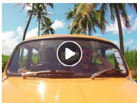
HERITAGE LE CHÂTEAU UNVEILS ITS NEW MENU BY DAVID TOUTAIN