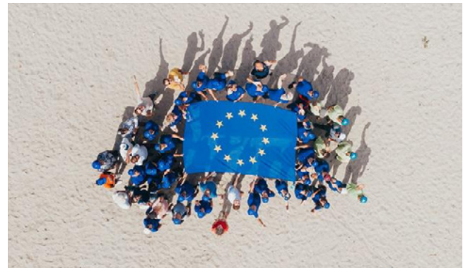
#EUBEACHCLEANUP 2019 IN MAURITIUS AND SEYCHELLES